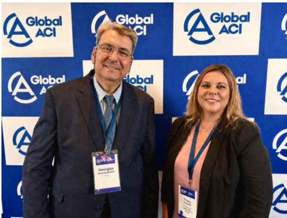
Reuniones intermedias de la Corporación Global de Acreditación Incorporada (Global ACI) en Praga, República Checa (20-26 de abril de 2026)