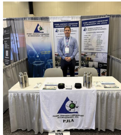
Pittcon 2026, Saan Antonio (9-11 de marzo de 2026)